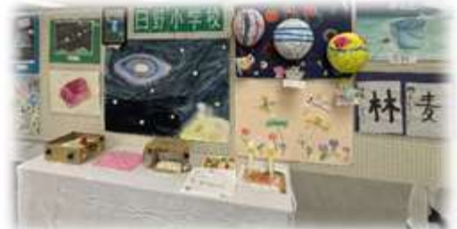
いずみ・ひまわり学級「あゆみ展」